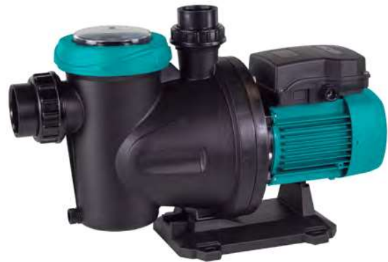
Tabla de características