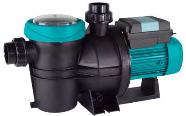
Tabla de características

Descarga ESPA Evopool App para una mejor experiencia y gestión