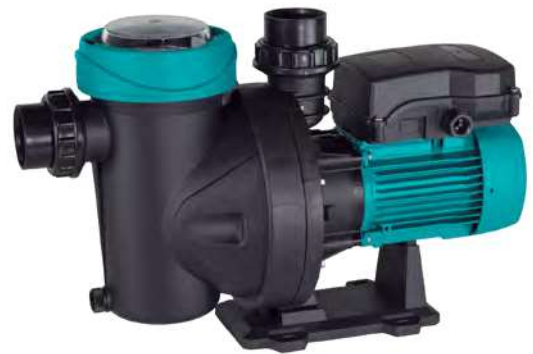
Tabla de características