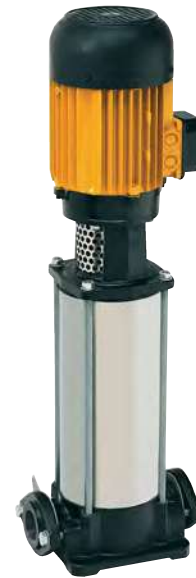
Tabla de características