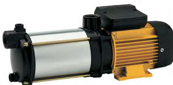
Tabla de características