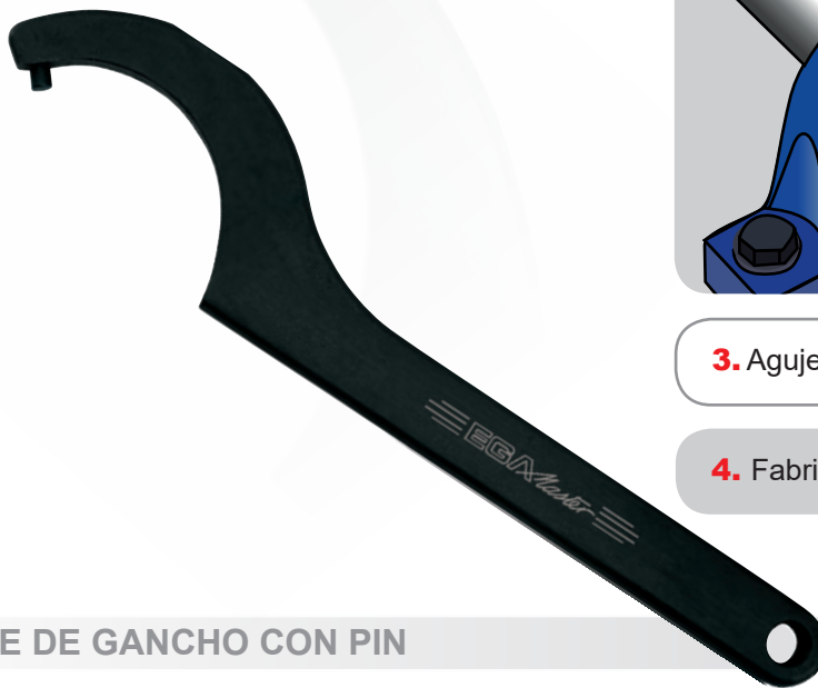
LLAVE DE GANCHO CON PIN

4. Fabricada de acuerdo a la norma DIN 1810.