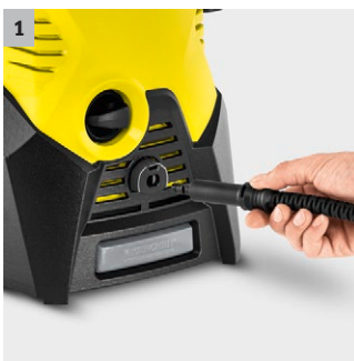
1 Quick Connect