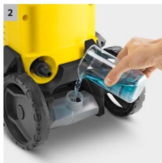
2 Limpia solución de depósito